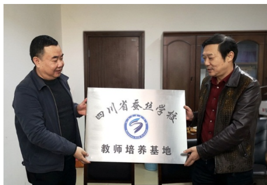
与西华师大签约建立教师培养基地

通过“学校—部门—个人”三级规划，使教师的培养做到“驱动”与“自动”融合，充分激发教师自我成长的能动性，促进教师终身发展。