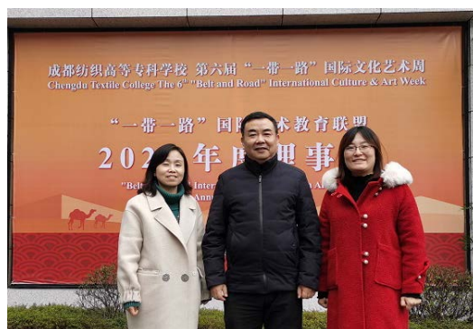
专业带头人参加国际交流会议