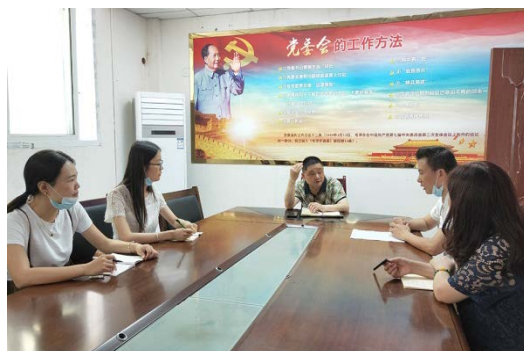
开展“乡村财务现状及对策”

上的改进。学校通过开展校级课题研究、加强教研组工作考核、校本课程开发、专家讲座、教学能力大赛、聘请专家导师、“选修课互联网+”行动计划等手段，多措并举提升教师教改能力。