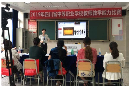
参加教学能力大赛

教学研究、课程开发能力弱是中职师资存在的普遍问题。从而使大多数教师很难结合经济社会发展新趋势，开发丰富的课程资源和开展科学系统的教育研究，从而使教师的成长仅仅停留在教育行为层面