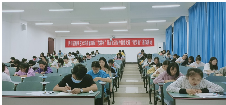
2020 年校企联合第四届“东蒙杯”服装设计制作学生技能大赛比赛现场

通过对全国职业院校技能大赛规程研究及服装专业教师训赛参赛经验总结，结合本专业实际教学情况。按全国职业院校技能大赛比赛标准，规范专业课程标准和细化学科考核评价内容。目前，完成 8 门专业核心课程和 5 门专业方向性课程课标编写和考核评价标准制定，并在实际教学中实施。实施过程由学校、企业、院校三方共同参与，学生在学校完成专业理论知识与专业技能学习后，通过校内“东蒙杯”服装设计与工艺专业技能大赛进行综合考核，再由校、企业、院校三方对考核结果进行评价，对考核暴露的问题进行梳理分析后，安排经比赛遴选的学生由专业老师带领到企业进行实践教学，解决比赛中暴露的问题，然后梳理学生企业教学实践中解决问题的方法途径，总结经验，再回校指导教学改革。形成了以赛导学，围绕国赛标准，从“教学改革—教学实施—比赛—三方评价—分析诊改—教学改革”的闭环。