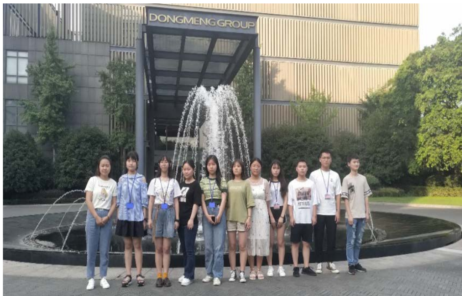
技能赛遴选学生到福建东蒙集团有限公司进行暑期实践教学