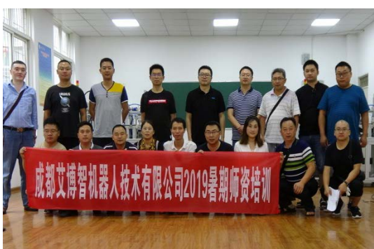
骨干教师企业实践培训