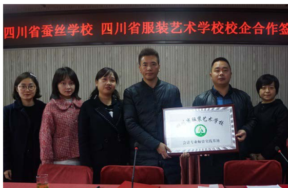
与成都精沛签约建立教师实践基地